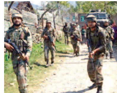
कनेमजार क्षेत्र में तलाश अभियान शुरू किया। उन्होंने बताया कि सुरक्षा बलों के जवान जब

डेली संवाद, श्रीनगर। जम्मू-कश्मीर की ग्रीष्मकालीन राजधानी श्रीनगर के पुराने इलाके में सुरक्षा बलों की घेराबंदी तथा तलाश अभियान के दौरान मंगलवार को आतंकवादियों के साथ मुठभेड़ में दो आतंकी मारे गए जबकि केंद्रीय रिजर्व पुलिस बल (सीआरपीएफ) के एक जवान सहित तीन सुरक्षाकर्मी घायल हो गए। एक पुलिस अधिकारी ने बताया कि आतंकवादियों की मौजूदगी की खुफिया सूचना के आधार पर राज्य पुलिस के विशेष अभियान दल और सीआरपीएफ के जवानों ने मंगलवार को तड़के दो बजे श्रीनगर में नवाकदल की घनी आबादी वाले