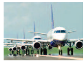
अगले तीन महीने तक लागू रहेगा। केंद्रीय नागर विमानन मंत्री हरदीप

डेली संवाद, नई दिल्ली : केंद्रीय नागर विमानन मंत्री हरदीप सिंह पुरी ने 25 मई से घरेलू उड़ानों का ऑपरेशन शुरू करने की घोषणा कर दी है। इस घोषणा के साथ, उन्होंने एयर फेयर की अधिकतम एवं न्यूनतम सीमा भी तय कर दी है। मंत्रालय द्वारा एयर फेयर पर लगाया गया यह कैप